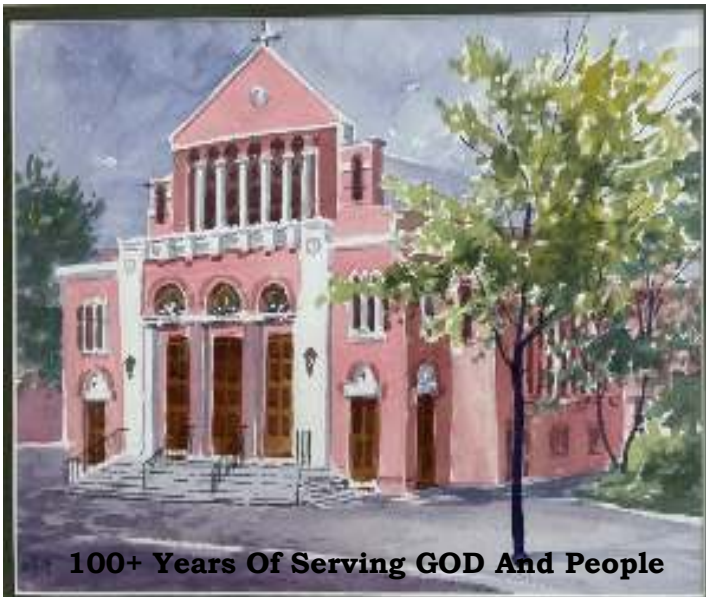
100+ Years Of Serving GOD And People

82-00 35 TH AVENUE JACKSON HEIGHTS, N.Y. 11372